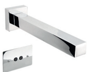
Torneira Sensor Parede Kúbica 90.570