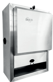
Toalheiro Inox Bobina SENSOR 29.740