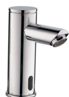
Torneira Sensor Bancada Pólux 80.236