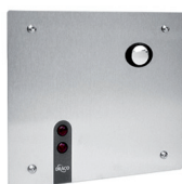
Válvula de Descarga Sensorizada Eco 90.490