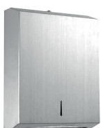
Dispenser Papel Toalha Interfolhado Inox BASIC 74.103