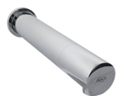
Torneira Sensor Parede Linea 80.355