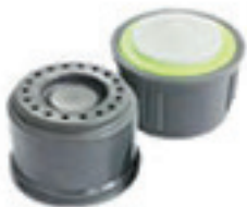
Dispositivo ECO DESCARGA 80.172