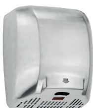
Secador de Mãos Sensorizado Mach G2 71.009