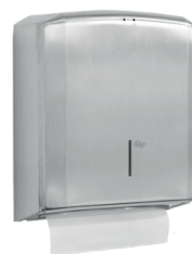
Papeleira Inox Papel Interfolhado STAR 70.106