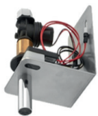
Torneira Sensor Embutir Atrás do Espelho Free 82.228