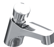
Torneira Pressão Bancada Dracopress G3 90.400