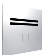
Válvula de Descarga Antivandálica Pólux 80.300