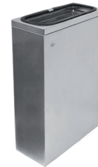
Lixeira Inox 50 Litros QUADRAT 7 70.227