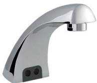
Torneira Sensor Bancada Eco 90.274