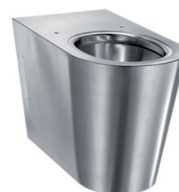
Bacia Sanitária Inox 721 BOX 70.700