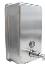
Saboneteira Pressão Parede Dracopress 70.131