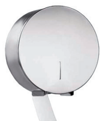
Porta Papel Higiênico Inox ROLÃO 74.784