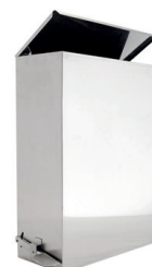
Lixeira Inox Basculante e pedal QUADRAT 7 70.330