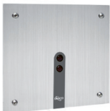
Válvula de Mictório Sensor Eco 90.640