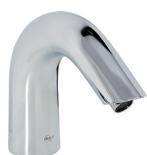
Torneira Sensor Bancada Classic 80.291