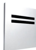
Válvula de Mictório Sensorizada Pólux 80.100