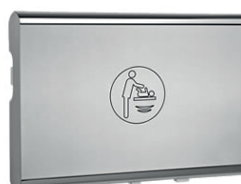
Trocador Inox Baby Medi 70.116