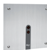
Válvula de Mictório Sensor Eco 90.640