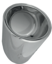
Mictório Inox Prime 26 70.401