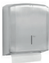
Dispenser de Papel Toalha Interfolhado PRIME 70.106