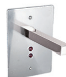
Saboneteira Sensor Parede KÚBICA 90.533