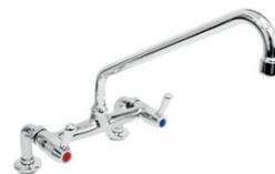
Torneira Parede com Bica PRÉ - RINSE 69.100