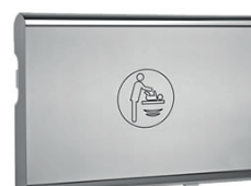
Trocador Inox Baby Medi 70.116