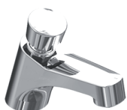
Torneira Pressão Bancada Dracopress G3 90.400