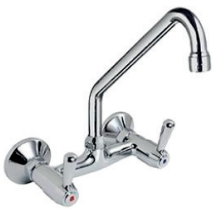
Misturador Parede PRO 64.211