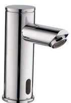
Torneira Sensor Bancada PÓLUX 80.236