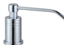
Saboneteira Bancada Dracopress G2 73.142