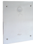
Válvula de Descarga Antivandálica ECO TOQUE 90.510