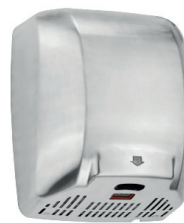
Secador de Mãos Sensorizado Mach G2 71.009