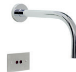
Torneira Sensor Parede CLINICAL 90.550