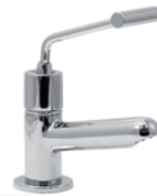
Torneira bancada Temporizada PNE 60.372