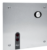
Válvula de Descarga Sensorizada Eco 90.490