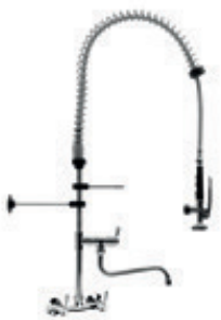
Misturador Parede com Bica PRÉ - RINSE 53.100