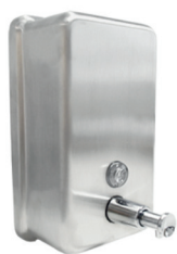
Saboneteira Pressão Parede DRACOPRESS 70.131