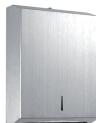
Dispenser Papel Toalha Interfolhado INOX BASIC 74.103