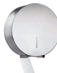
Porta Papel Higiênico Inox ROLÃO 74.784