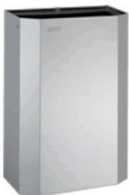
Lixeira Inox 25 Litros Star STAR 70.279