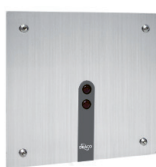
Válvula de Mictório Sensor Eco 90.640