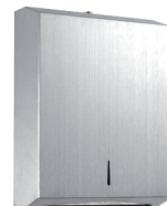
Dispenser Papel Toalha Interfolhado INOX BASIC 74.103