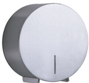
Porta Papel Higiênico Inox ROLÃO 74.101