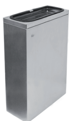
Lixeira Inox 25 Litros QUADRAT 9 70.229